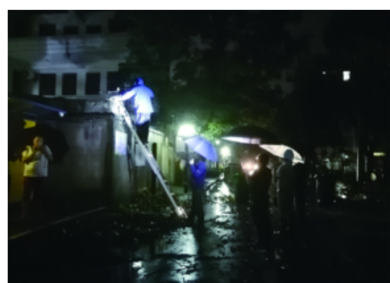
衢化街道启动防汛应急响应机制,街道干部在排查中发现滨三村社区交通要道上有大树受暴雨影响倒伏在路中间,第一时间联系电力、联通、移动等相关部门连夜抢修。