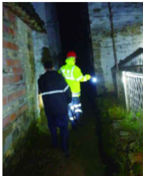
石梁镇镇村两级干部以及网格员、巡查员全面下沉一线,对危旧房、山塘、水库、小流域、山洪灾害隐患点等危险区域进行排查。