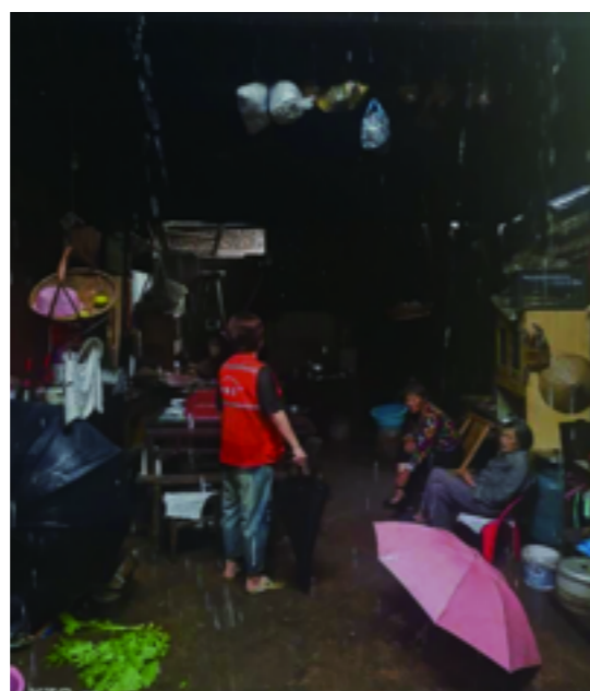
姜家山乡加强对山塘水库、危房、建筑工地、桥洞及积水路段的不间断巡查,第一时间转移人员处置险情,并确保防汛物资及时到点到位。