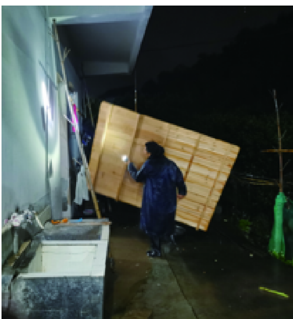
沟溪乡宋家垅村组团联村—网格走亲团在防汛排查中发现一栋老房内有老人居住,立即将老人转移至儿子家中居住。因临时转移,儿子家中无合适的床铺,联户党员立马从自家搬来床给老人使用。