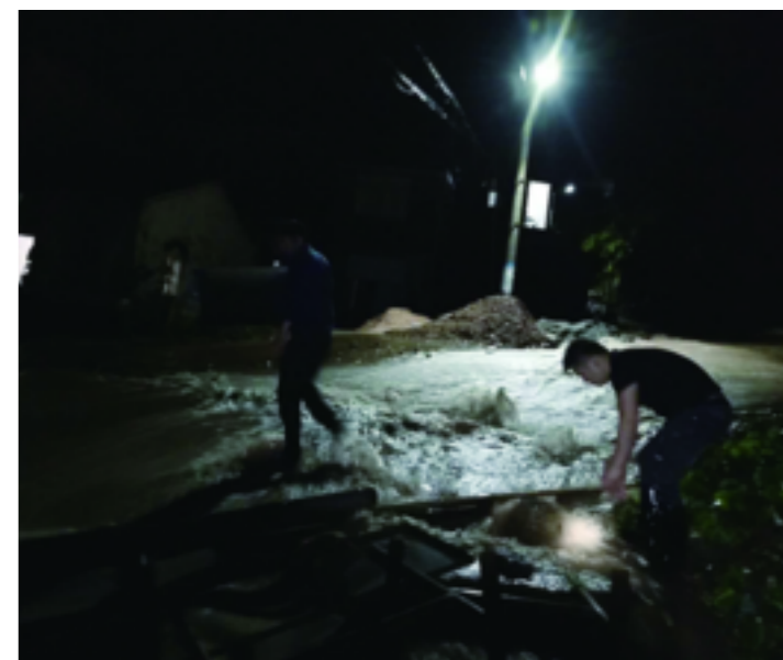
华墅乡组织乡、村两级干部对辖区内的危旧房、山塘水库、地质灾害隐患点等进行巡查,24小时值守。