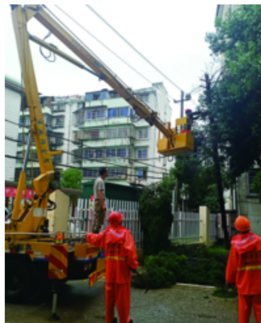
荷花街道重点排查老旧小区C级危房,在排查中发现兴华东区一棵柏树被雨水冲刷得连根拔起,网格员立即通知车主移车,并组织保洁公司进行应急处理。