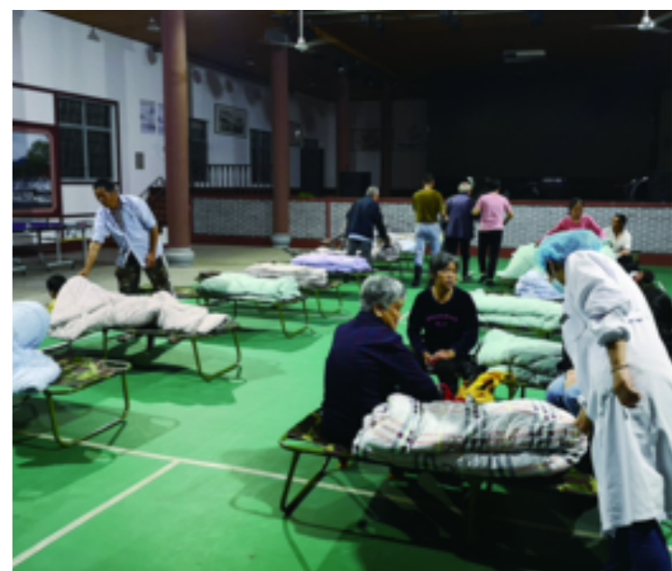
6月4日凌晨00:25左右,九华乡大侯村小佃坞发生险情。00:30,九华乡启动防汛应急预案,全体乡干部赶赴现场分组转移村民。同时,新宅村、上清村、茶铺村、上铺村组成4个应急救援分队赶赴现场实施增援。