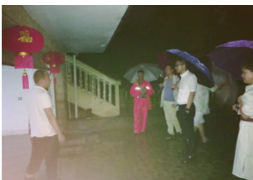
双港街道开展辖区安全隐患排查工作,尤其对老旧小区、沿岸河堤、在建工程、危旧房屋等重点区域进行反复排查。