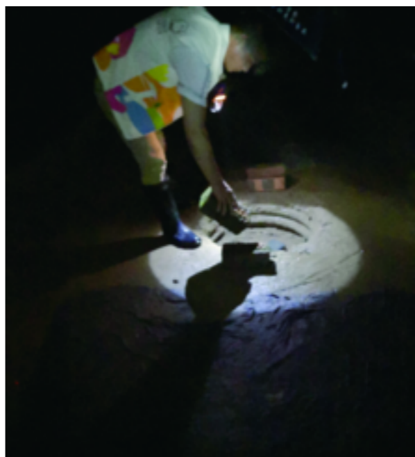
花园街道全面排查辖区排水管网情况,对积水、成涝、井盖缺失部位做好安全警示,加强沿河村居巡逻。