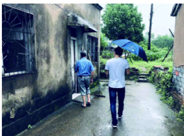
信安街道入户开展全面大排查、大走访,重点排查村中危旧房、低洼地带、危树处,指导居民做好汛期应对工作。