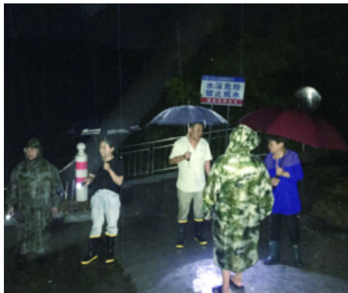
航埠镇充分发挥“党建+网格”的战斗作用,一户不漏、一人不落地全面排查危旧房,并重点对常山港沿线各村开展防汛检查。