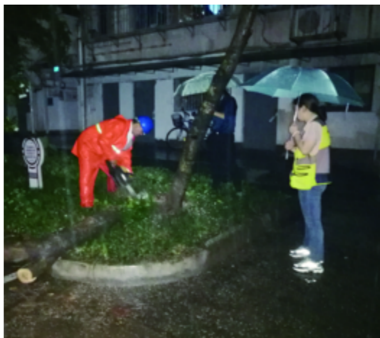
府山街道全体干部下沉网格,对危旧房、隐患点进行排查,查看河道水位,发现问题及时上报处理。