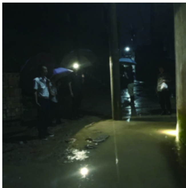
万田乡各组团联村成员下沉网格进行全方位摸排,24小时严密监测村庄汛情,重点巡查翁塘壑、庙源溪下方段、三和村等地的水位。