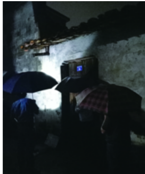
石室乡组织乡、村两级干部开展防汛值班巡查工作,乡、村轮值干部坚守岗位,为人民群众的生命财产安全保驾护航。